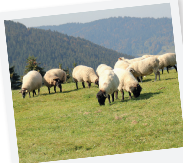
LES MOUTONS DE VENTRON