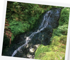
LA CASCADE DU CUISINIER