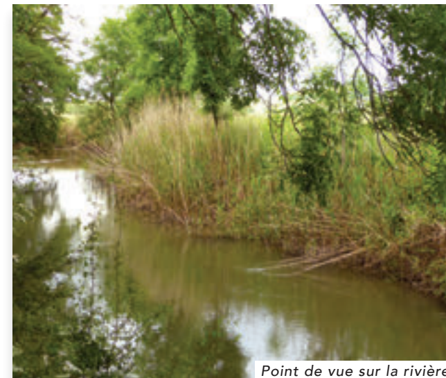
Point de vue sur la rivière

De retour à Han, prenez à gauche la rue principale pour rejoindre le parking de départ.