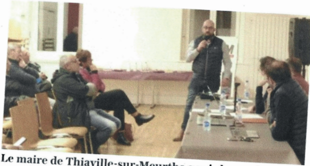
Le maire de Thiaville-sur-Meurthe a pris la parole.

La 30e assemblée générale de l'association Canal Myrtille s'est tenue ce vendredi 9 février à la salle Poirel, marquant une étape importante pour cette structure dynamique.