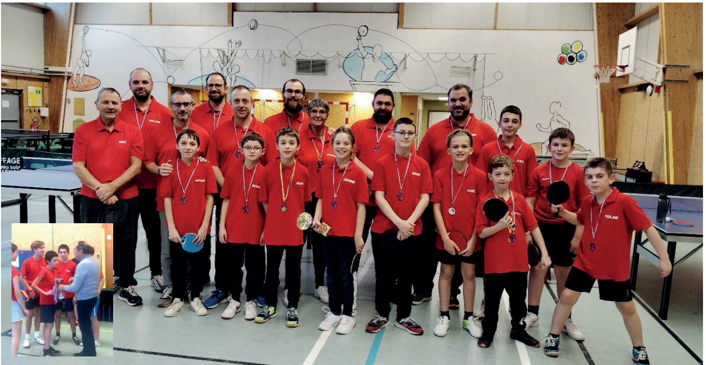
FR de Velaine sous Amance qui remporte la coupe des plus nombreux : 20 participants