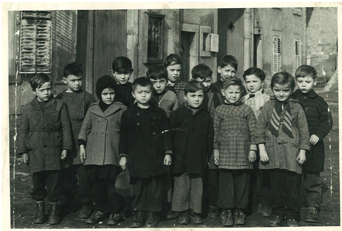
Photo école année 1953 Place de la mairie