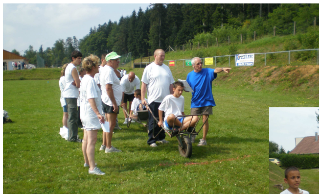
Jeux intervillage 2009