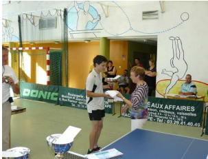
Tournoi 2009 du tennis de table